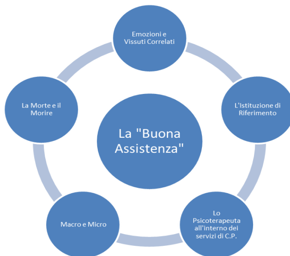
Tav.1 - Mappatura dei contenuti tematici del gruppo

Riportiamo di seguito uno schema sintetico della mappatura dei contenuti tematici complessivamente emersi nel gruppo. Esso può essere utile a tenere una visione di insieme di quanto esposto nei paragrafi successivi.